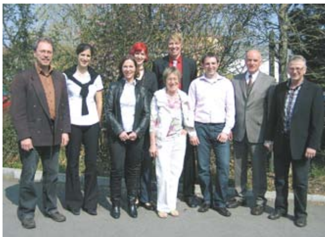
Die diesjährigen DSLV-Preisträger(innen) mit den Betreuer(inne)n ihrer Arbeiten zur 2. Dienstprüfung