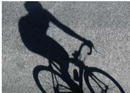
Die Freiburger Sportmedizin im Schatten des Dopingskandals